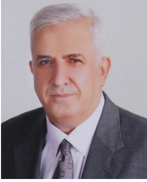
Selami Sırlı Oda Sicil No: 2796