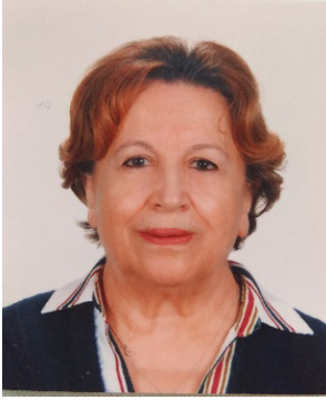
Bilgin Kömbe Oda Sicil No: 1549