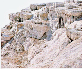
PAMUKKALE TRAVERTENLERİ Bu harika traverten terasları, kireçtaşı alanlarındaki sıcak su kaynaklarından kalsit çökelmesi ile oluşmuştur. Traverten dekoratif yapıtaşı olarak da kullanılır.

Kesici araçları keskinleştirmede esası sert zımpara taşı olan masat veya bileme taşı kasapların vazgeçilmez araçlarındandır.