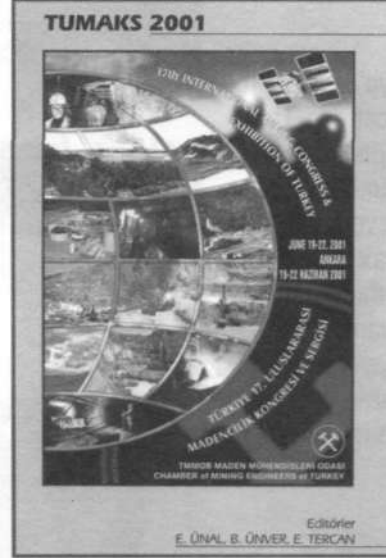
TÜRKİYE 17. ULUSLARARASI MADENCİLİK KONGRESİ VE SERGİSİ Editörler: E. ÜNAL, E. TERCAN