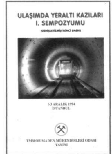
ULAŞIMDA YERALTI KAZILARI 1. SEMPOZYUMU Revizyon Editörü: Öner YILMAZ EYLÜL 2002