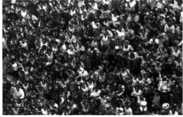
İnsanlar ah bizim insanlarımız Yalanla besliyorlar sizi... (Burası da Afrika)

"Şimdi hapı yuttuk! Bunlar Tanrıyı kaybetmişler, bizden biliyorlar"... •