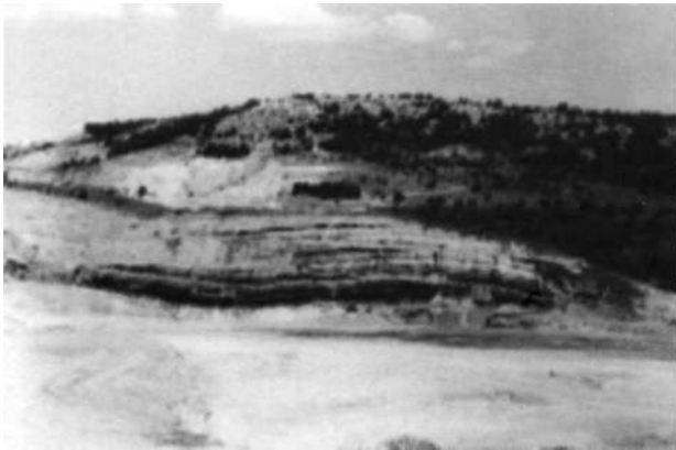
Dağlar Mostra veriyor Soma'da. Karaaltın yakınlarında...