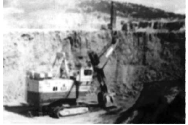
Soma'da Dekapaj... Kömüre az kaldı...