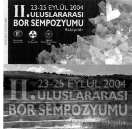
II. ULUSLARARASI BOR SEMPOZYUMU 23-25 EYLÜL 2004 ESKİŞEHİR