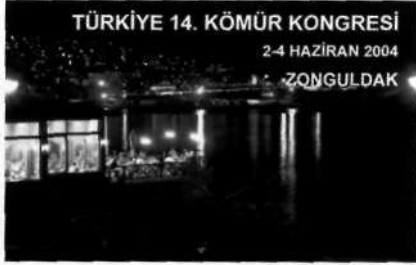
TÜRKİYE 14. KOMUR KONGRESİ 02-04 HAZİRAN 2004 ZONGULDAK