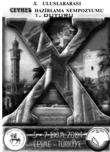
X. ULUSLARARASI CEVHER HAZIRLAMA SEMPOZYUMU 05-07 EKİM 2004 ÇEŞME/İZMİR