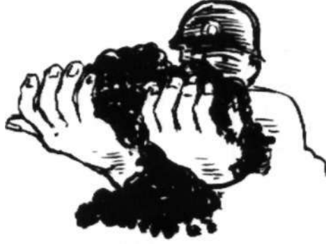
Çizim: Süleyman Bilgin

Dahası MADENCİLİĞİN VE EMEĞİN formüllere sığmadığını kavıyor. •