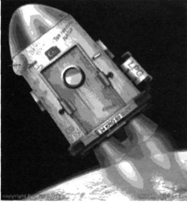
İlk Türk Uzay Mekiği