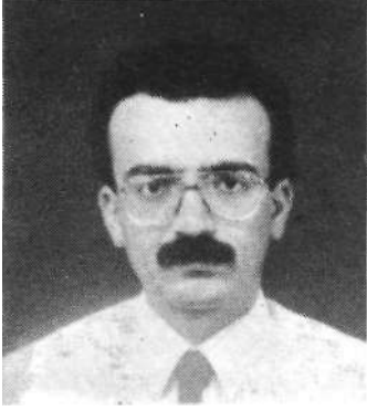
Ethem TORUNOĞLU TMMOB Çevre Mühendisleri Odası Başkanı