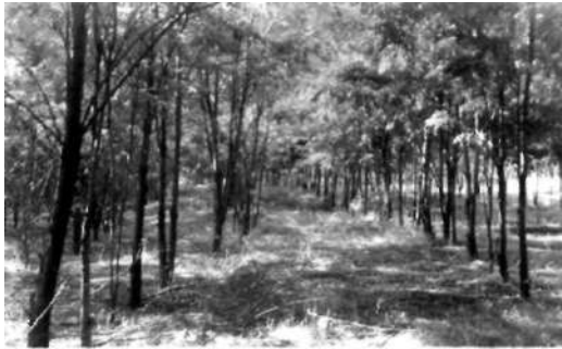
TKİ Genel Müdürlüğü tarafından yapılmış bir ağaçlandırma

Ülkemizde madencilik yapılan alanların tekrar kazanımı ile ilgili uygulamalar uzun yıllardan bu yana artarak süregelmektedir. Kömür İşletmeleri Genel Müdürlüğü üretim alanlarının hemen hemen tamamında üretim sonrası ağaçlandırma yapmaktadır.