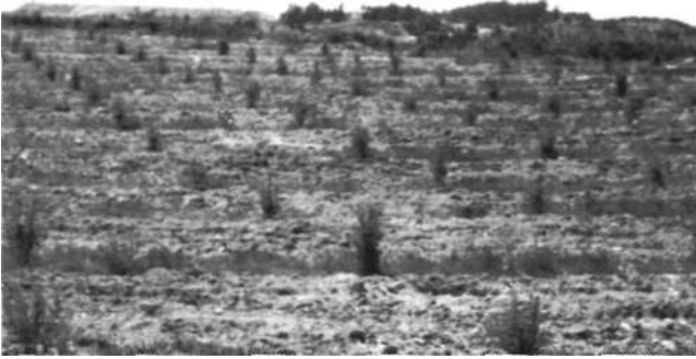
Aydın tin. işit. A.Ş. 'ne ait madencilik yapılmış alandaki zeytin fidanlığı, Şahnalı-Aydın 2003

Firmanın uyguladığı en ilgi çeken proje de madencilik yapılan bölgelerin zeytinlik haline getirilme çalışmalarıdır. Bu kapsamda madencilik yapılmış geniş alanlara zeytin fidanları dikilmiştir. Şimdi 5 yaşında olan bu zeytin fidanları 3 yaşından itibaren ürün vermeye başlamıştır. Bu fidanların önümüzdeki 6 ncı yıl itibarı ile de ticari anlamda ürün vermesi beklenmektedir.