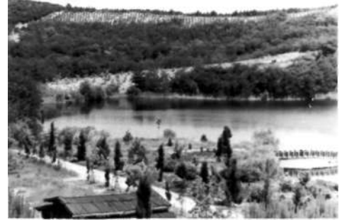
Kemerburgaz Kömür Üretim Sahasındaki ağaçlandırma ve suni gölet

Kemerburgaz'da Kutman Madencilik'in kömür üretimi sonrası ağaçlandırma alanı içinde oluşturduğu suni gölette sazan balığı üretilmektedir.