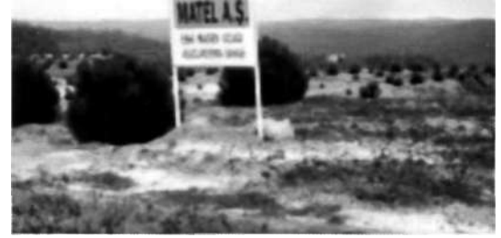
Şile Bölgesinde Matel A.Ş. tarafından yapılmış ağaçlandırma

İstanbul Şile bölgesinde kil üretici firmalar madencilik faaliyetleri sonrası üretim yapılan alanları ağaçlandırmaktadırlar. Bölgede faaliyet gösteren Matel Firması yaptığı ağaçlandırmalardan dolayı İstanbul Sanayi Odası tarafından 2000 yılı Çevre Ödülü'ne layık görülmüştür. Firma 1993 yılından 2000 yıla kadar 3 ayrı ağaçlandırma sahasına toplam 10.000 adet çam fidanı dikmiş, o tarihten sonra da sonra da üretim yapılan rezervi bitmiş alanlarda fidan dikimine devam etmektedir. Bölgedeki diğer madenciler de ağaçlandırma çalışmalarını sürdürmektedirler.