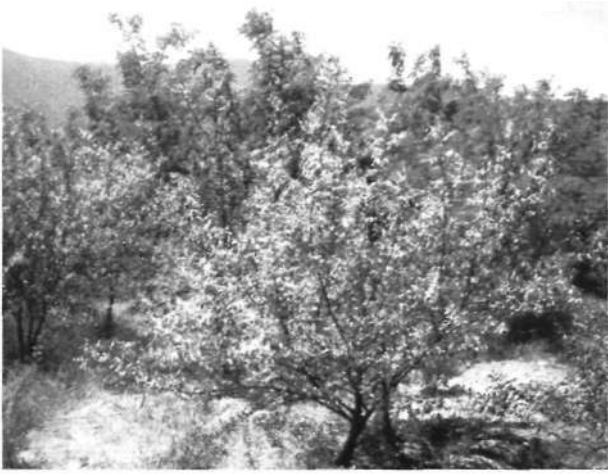
Aydın Lin. İşit. A.Ş. 'ne ait madencilik yapılmış alan üzerinde ağaçlandırma, Şahnalı-Aydın 2003

Firmanın uyguladığı en ilgi çeken proje de madencilik yapılan bölgelerin zeytinlik haline getirilme çalışmalarıdır. Bu kapsamda madencilik yapılmış geniş alanlara zeytin fidanları dikilmiştir. Şimdi 5 yaşında olan bu zeytin fidanları 3 yaşından itibaren ürün vermeye başlamıştır. Bu fidanların önümüzdeki 6 ncı yıl itibarı ile de ticari anlamda ürün vermesi beklenmektedir.